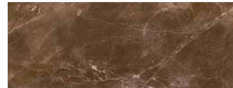
VENEZIA PULPIS 45x120x1cm P3580007 / 100179795 G270 Butech recomienda junta / Butech recommends joint: Colorstuk Rapid n Moka B21522220 / 100060549