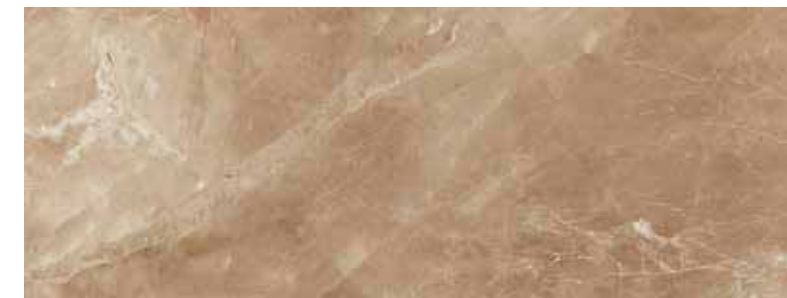
VENEZIA TOPO 45x120x1cm P3580000 / 100179815 G270 Butech recomienda junta / Butech recommends joint: Colorstuk Rapid n Tabaco B22502011 / 100004304