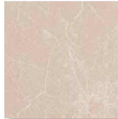
VENEZIA MARFIL 59,6x59,6x1,1cm P1857011 / 100179794 G347 Butech recomienda junta / Butech recommends joint: Colorstuk Rapid n Cemento B22502004 / 100004297