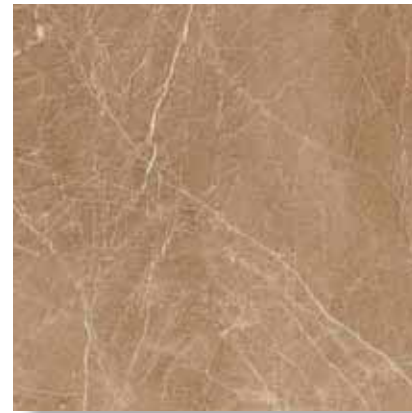
VENEZIA TOPO 59,6x59,6x1,1cm P1857010 / 100179796 G347 Butech recomienda junta / Butech recommends joint: Colorstuk Rapid n Manhattan B22502002 / 100004295