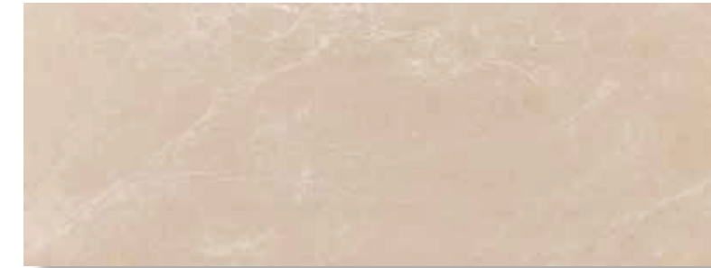
VENEZIA MARFIL 45x120x1cm P3580002 / 100179793 G270 Butech recomienda junta / Butech recommends joint: Colorstuk Rapid n Marfil B22502009 / 100004302