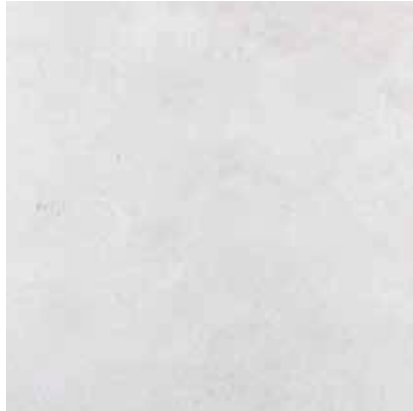
PORTLAND CALIZA S-R 59,6x59,6x1,1cm P1856855 / 100135548 G354 Butech recomienda junta / Butech recommends joint: Colorstuk Rapid n Gris B22502013 / 100004305