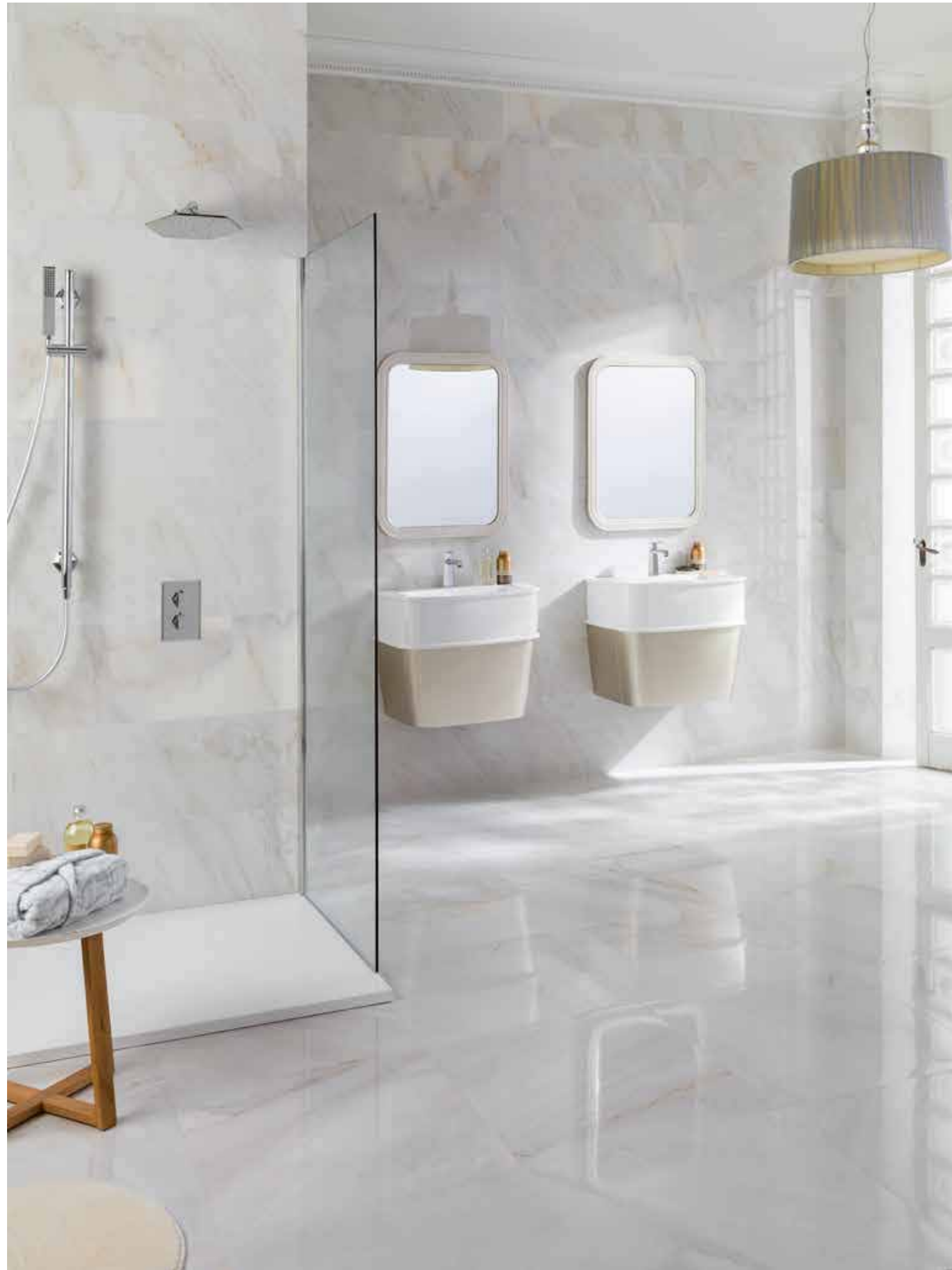
# BALI BLANCO 59,6x59,6cm