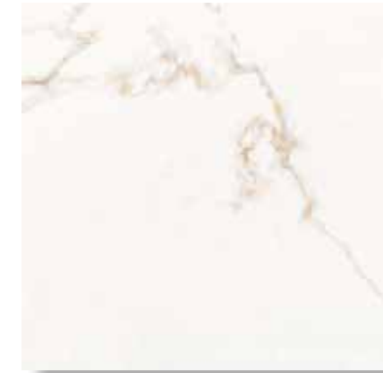
PERSIA P-R 59,6x59,6x1,1cm P1856999 / 100179118 G347 Butech recomienda junta / Butech recommends joint: Colorstuk Rapid n Blanco B22501001 / 100004294