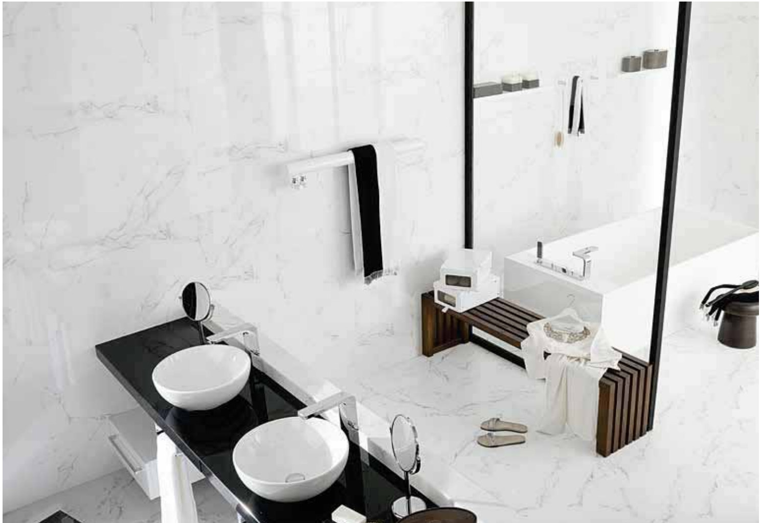
# MÁRMOL CARRARA BLANCO 31,6x90cm

FLOOR TILES COMBINATIONS: CARRARA SERIES 43,5x43,5cm · PAG.205