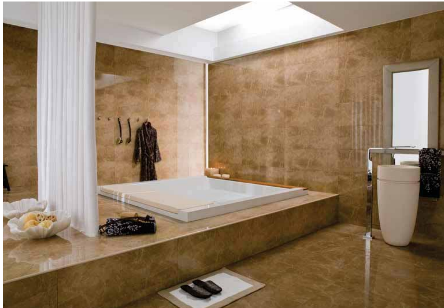
# KALI TABACO 31,6x90cm