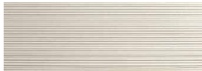
ATENAS MARFIL 31,6x90x1,1cm P3470436 / 100093296 G271 Butech recomienda junta: Colorstuk Beige / Butech recommends joint: Colorstuk Beige