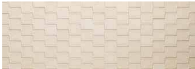
CERDEÑA SCALA MARFIL 31,6x90x1,2cm P3470709 / 100145668 G271 Butech recomienda junta: Colorstuk Beige / Butech recommends joint: Colorstuk Beige