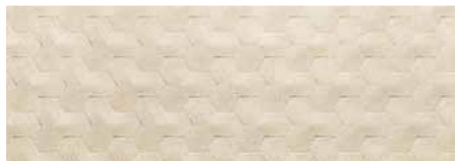
HANNOVER MARFIL 31,6x90x1,25cm P3470689 / 100135666 G271 Butech recomienda junta: Colorstuk Beige / Butech recommends joint: Colorstuk Beige