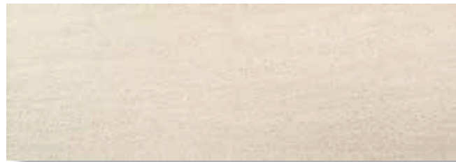
CERDEÑA MARFIL 31,6x90x0,9cm P3470515 / 100096392 G261 Butech recomienda junta: Colorstuk Beige / Butech recommends joint: Colorstuk Beige