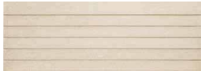
CERDEÑA LINE MARFIL 31,6x90x1,23cm P3470706 / 100145667 G271 Butech recomienda junta: Colorstuk Beige / Butech recommends joint: Colorstuk Beige