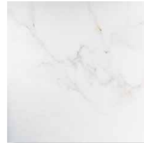
BARI BLANCO PULIDO S-R 58,6x58,6x1,0,3cm P9210485 / 100204043 G370 Butech recomienda junta / Butech recommends joint: Colorstuk Rapid n Blanco B22501001 / 100004294