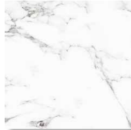
CALACATA SILVER PULIDO S-R 58,6x58,6x1,0,3cm P9210488 / 100204023 G370 Butech recomienda junta / Butech recommends joint: Colorstuk Rapid n Blanco B22501001 / 100004294