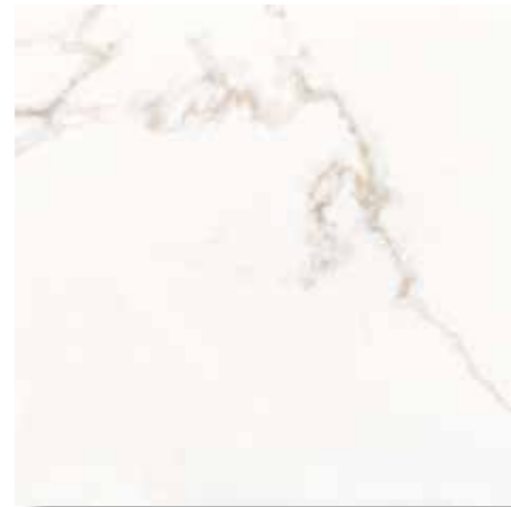
PERSIA PULIDO S-R 58,6x58,6x1,0,3cm P9210479 / 100204034 G370 Butech recomienda junta / Butech recommends joint: Colorstuk Rapid n Blanco B22501001 / 100004294