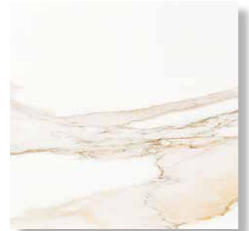
CALACATA GOLD PULIDO S-R 58,6x58,6x1,0,3cm P9210487 / 100204015 G370 Butech recomienda junta / Butech recommends joint: Colorstuk Rapid n Blanco B22501001 / 100004294