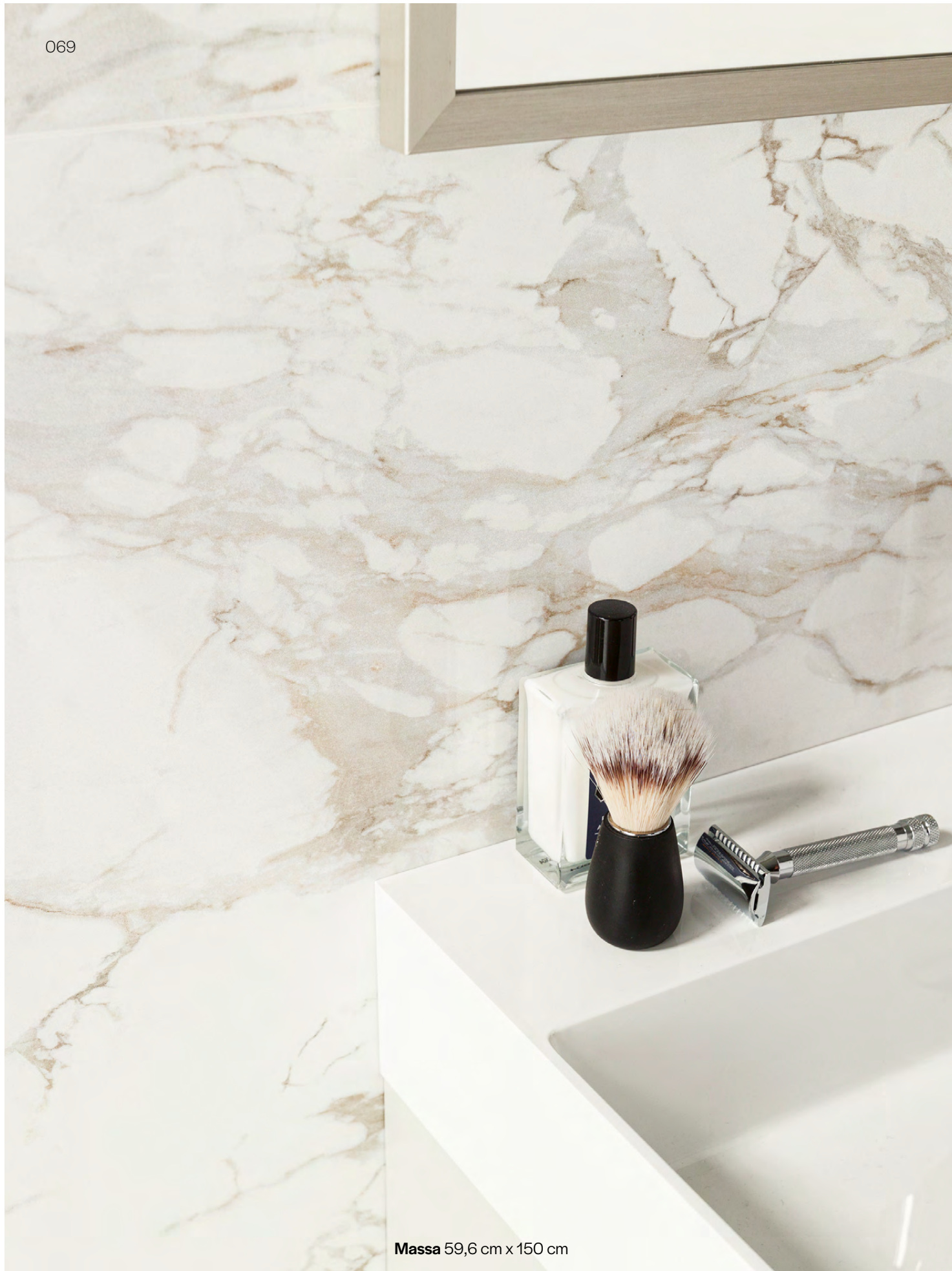
Massa 59,6 cm x 150 cm