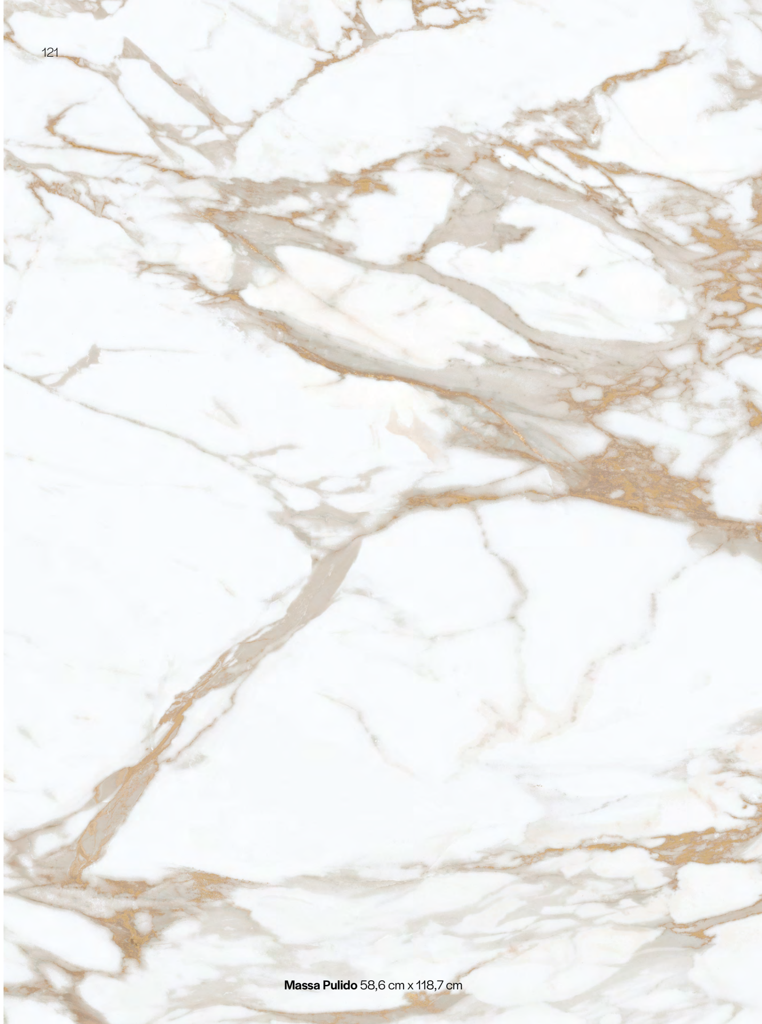
Massa Pulido 58,6 cm x 118,7 cm