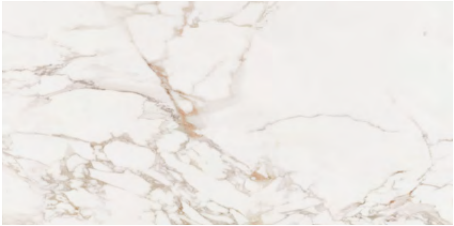
Massa Pulido 58,6 cm x 118,7 cm G389 Pavimento · Floor Tile HIGHKER