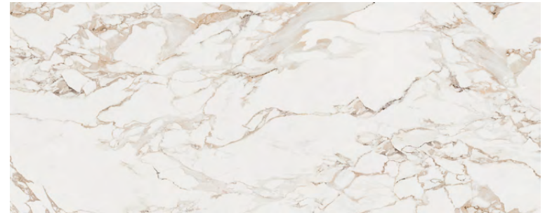
Massa Bookmatch B 59,6 cm x 150 cm G279 Revestimiento · Wall Tile