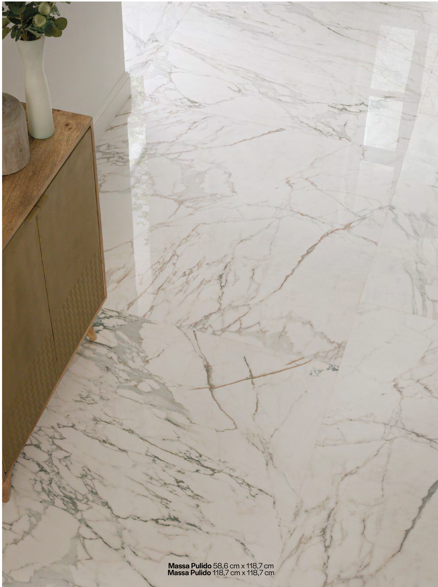
Massa Pulido 58,6 cm x 118,7 cm Massa Pulido 118,7 cm x 118,7 cm