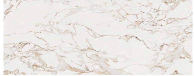
Massa Bookmatch A 59,6 cm x 150 cm G279 Revestimiento · Wall Tile