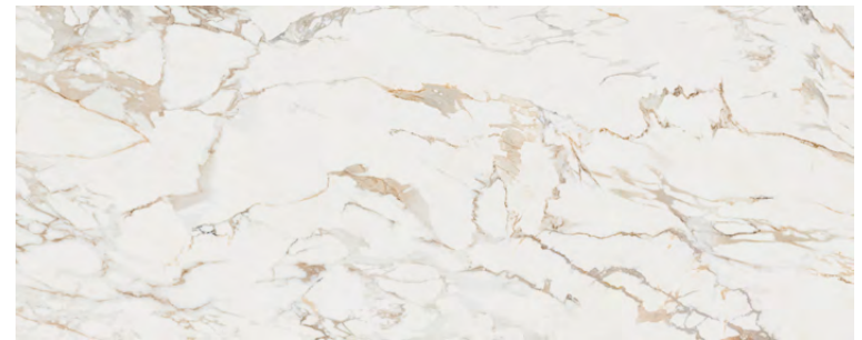
Massa 59,6 cm x 150 cm G276 Revestimiento · Wall Tile

Esta serie es combinable con todos los decorados de la colección Deco Marmi / This series can be combined with all the items in the Deco Marmi collection È possibile abbinare questa serie a tutti gli elementi di arredo della collezione Deco Marmi / Diese Serie kann mit allen Dekorationen der Deco Marmi-Kollektion kombiniert werden Monoporosa Rectificado / Brillo / Destonificado - Rectified Wall Tile / Gloss / Tone Variations Monoporosa Rectificata / Lustrò / Stonalizzazione - Monoporòs Rektifiziert / Glanz / Farbvariationen