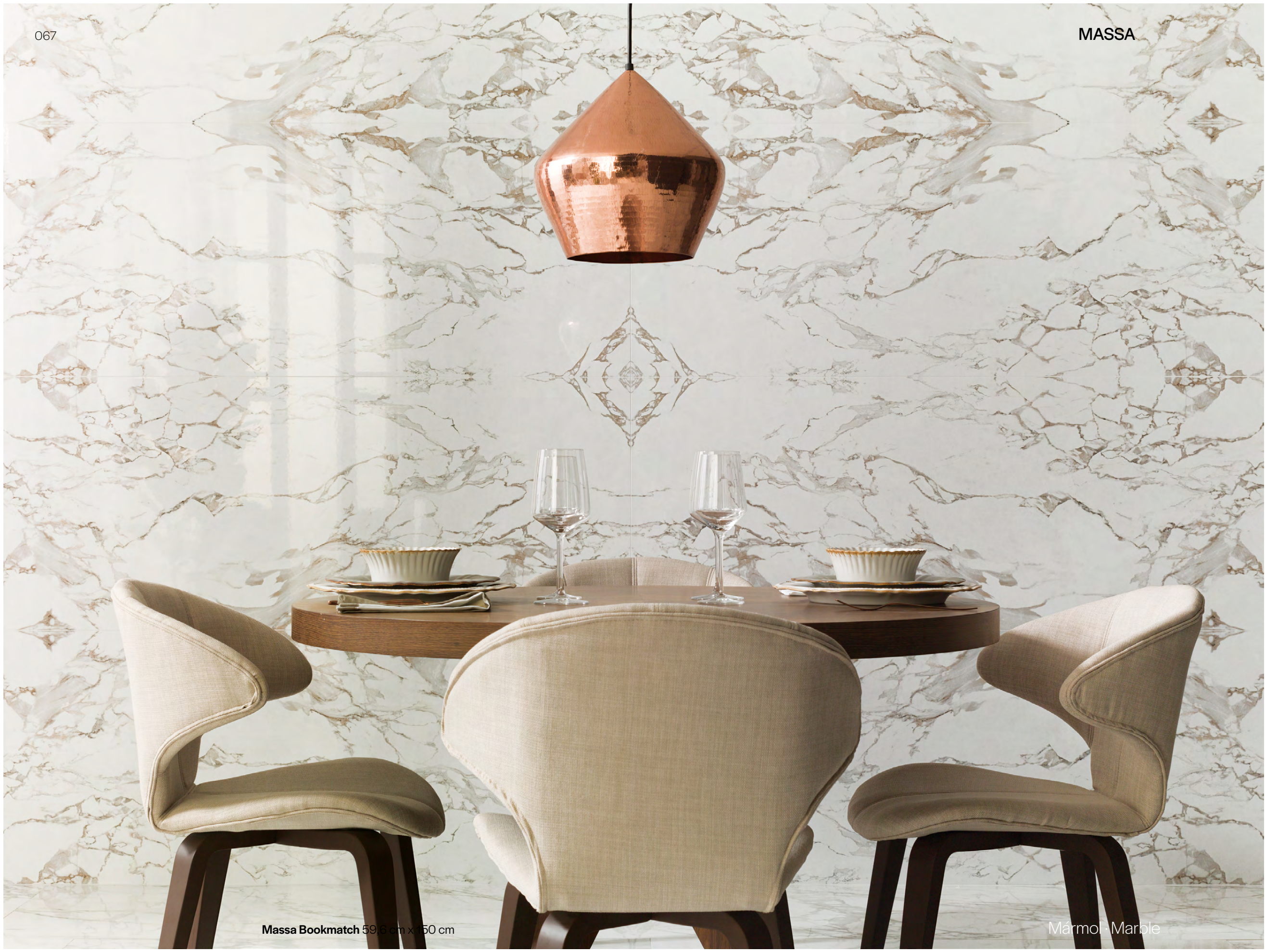
Massa Bookmatch 59,6 cm x 150 cm